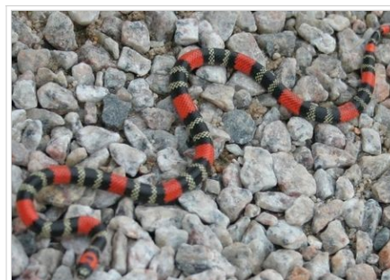
Micrurus altirostris ( ação pós-sináptica ): Cabeça com uma faixa vermelha, ou laranja, sobre a qual há duas escamas pretas, que formam um desenho semelhante a uma borboleta. Apresenta, ao longo do corpo, o padrão de três anéis pretos separados por dois anéis brancos (ou amarelos) e limitados por anéis vermelhos (ou laranjas). Seu tamanho médio fica entre 60 e 80 cm.