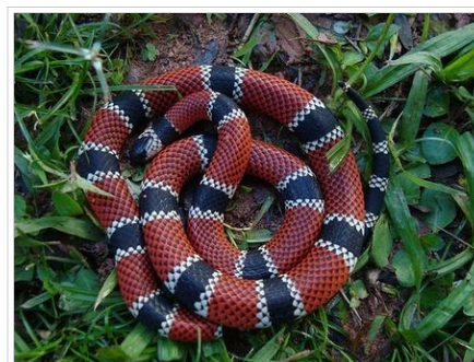
Micrurus corallinus ( ação pré-sináptica ): Possui a cabeça preta com faixa transversal branca. Seu padrão de coloração inclui anéis pretos margeados por anéis brancos e intercalados por anéis vermelhos. É uma das espécies mais comuns nas regiões Sul e Sudeste, principalmente no litoral. Seu tamanho médio encontra-se entre os 50 cm (machos) e 60 cm (fêmeas).