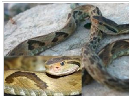
Bothrops jararaca - Fosseta loreal e desenhos na lateral do corpo